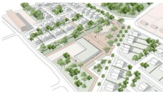
Esquisse AIA Territoires du Centre commercial des Feugrais et de ses abords – 2021

Outre l'engagement de la Région Normandie, l'Agence Nationale pour la Cohésion des Territoires (ANCT) a également confirmé en décembre 2022 son accompagnement financier au projet à hauteur de 926 000 €.